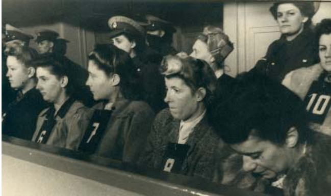
Aus: Sylvia Salvesen: Tilgi-men glem ikke. Oslo 1947; Kopie MGR [MG/Z | SBG, Sign: Fo III/B; 2285]