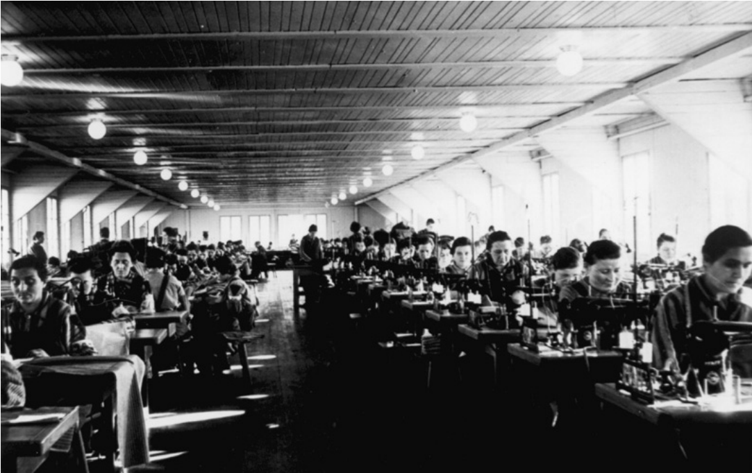
Aufnahme um 1941