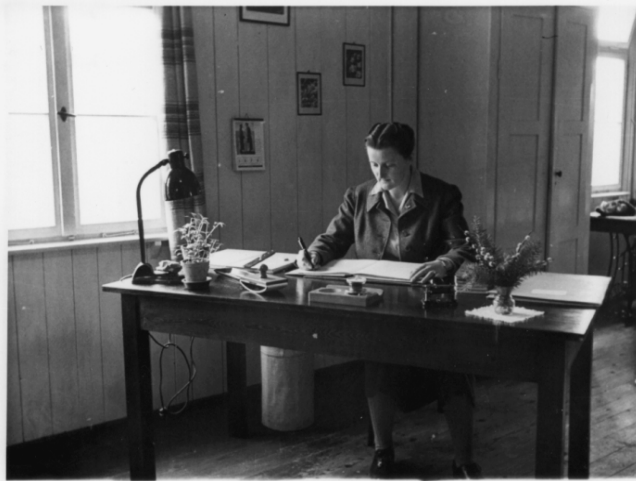
Aufnahme um 1941