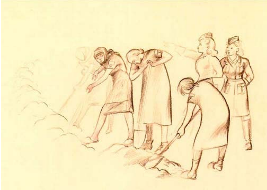
Aus: Helen Ernst: Frauen von Ravensbrück, Postkartenmappe, Dr.-Hildegard-Hansche-Stiftung, 2000